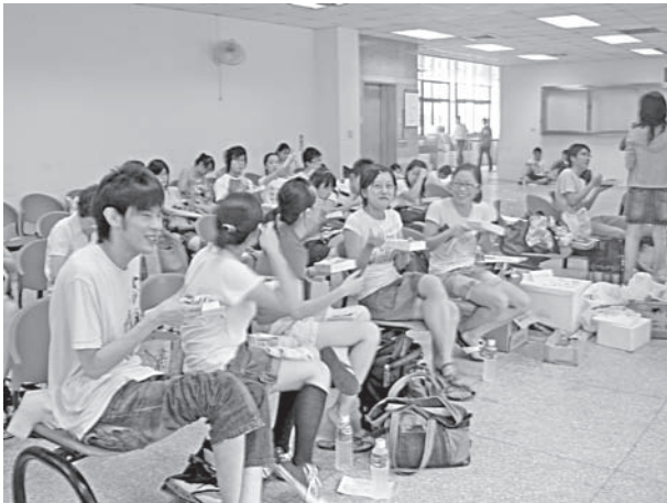
應屆畢業生中午休息用餐情況