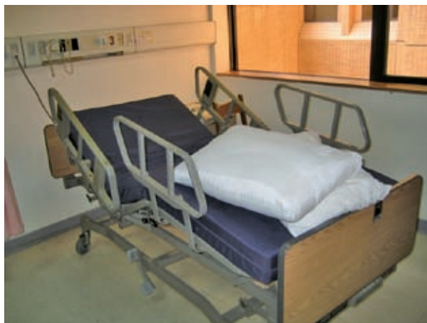
第五天早上，空無一人的病床

醫學院，是我們平常生活的地方；安寧病房，是末期病人人生中最後一個中途站。從來沒有想過，就在我平常和同學嬉笑打罵的同時，病房中或許就有幾個病人走了；從來沒有想過，就在我安靜午睡的同時，或許有幾個病人正由安眠中痛醒！咫尺之隔，兩邊的情境卻恍若天涯之遙。感謝系上讓我們有這個機會，這麼近距離體驗死亡，這次的經驗是深刻且難以忘懷的。我會更加珍惜我擁有的一切，我的家人、女朋友、同