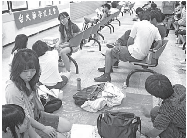
國考服務隊工作人員，替應屆畢業生佔休息區位子

小點心，還有幾箱瓶裝飲料，甚至還可以把飲料放入保麗龍保溫箱內，只要在裡頭放入冰塊就可以讓在炎炎酷日下努力的學長姐享受一下冰涼。