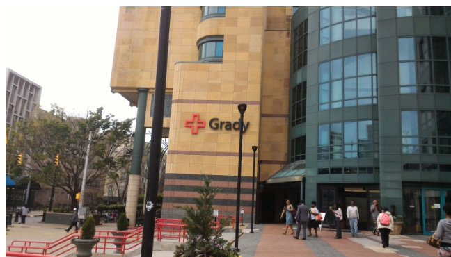
↑ 位於 Atlanta 市中心的 Grady memorial hospital

Grady memorial hospital 位在 Atlanta 市中心，是當地規模最大的醫院，病床數約 1000 床，照護病人涵蓋相當廣泛，除了小兒科病人以外，幾乎所有類型的病人都有照顧。因應 Atlanta 人口組成，Grady 的特色也應運而生。Atlanta 是全美國非裔美國人最多的城市之一，即便在這幾十年間民權抬頭下，多數非裔美國人仍處於較低的社會階層，導致 Atlanta(尤其在市中心)的治安偏差，槍案層出不窮。Atlanta 的毒品氾濫問題也相當嚴重，比如 cocaine, marijuana 等，尤其在同性戀族群中更甚，導致愛滋病、性病、C 型肝炎等傳染病相當盛行。非裔美國人的基因遺傳關係，容易患有鐮狀細胞型貧血(sickle cell anemia)。因應這樣的人口組成，Grady 不但有健全的急診系統，愛滋病門診及照護網，鐮刀型貧血門診及照護網等。此外 Grady 的外科以及燒燙傷病房的品質也是享譽全美的，甚至會有別州的病人用直升機運送到 Grady 尋求治療。