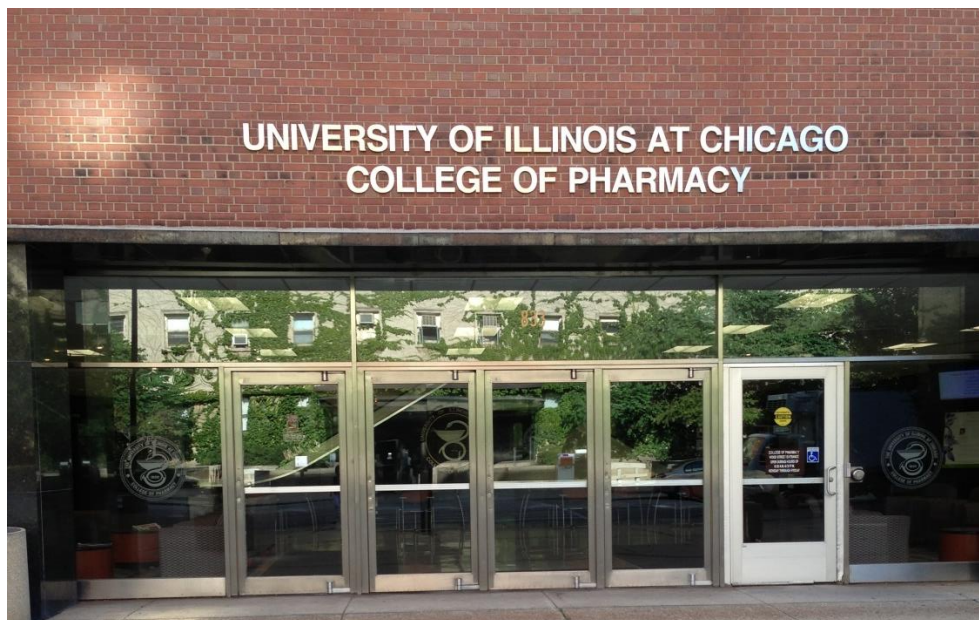
Figure 1 UIC 藥學院