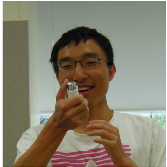
Figure 4 吸入劑衛教示範

介紹及病機轉與用藥選擇，並且使用吸入劑加深同學上課印象，下午案例主題為戒菸，評估病人的狀況選擇最適合的戒菸療法。