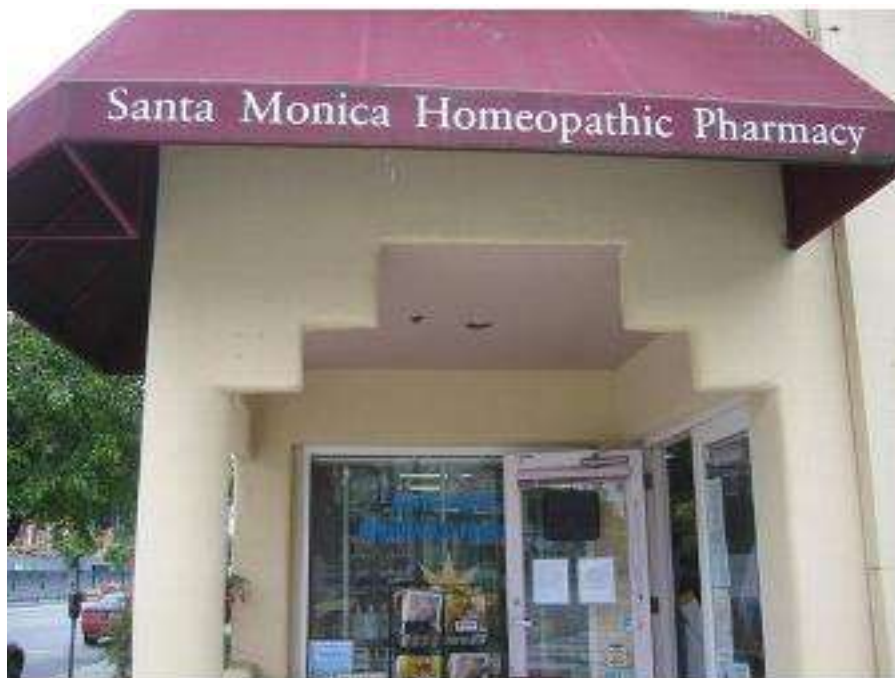
(The Santa Monica Homeopathic Pharmacy)

第二間參觀位於 Santa Monica 的 Homeopathic Pharmacy，過去不曾聽說過 Homeopathic，後來和同行的北醫藥師討論才知道台灣其實也有相關協會。中文翻譯作“順勢療法”。順勢療法在歐美相當盛行，源自德國 Samuel Hahnemann 的醫師，他提出當一個病患的症狀和藥物在健康人體實驗所產生的症狀相似時，這個藥物就可以治療病患的疾病，但要在高度的稀釋之下才能有治療效果。